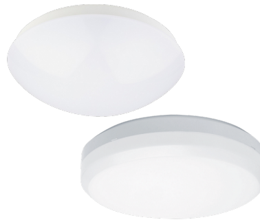
Armatur mit Treiber ohne Abdeckung