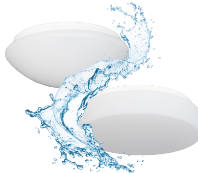
Armatur mit Treiber ohne Abdeckung