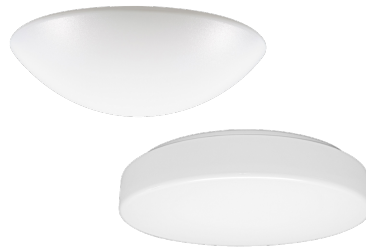
Armatur mit Treiber ohne Abdeckung