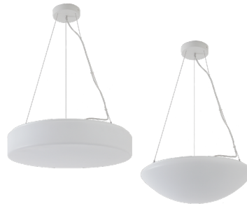
Armatur mit Treiber ohne Abdeckung